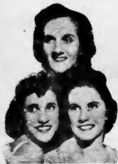
The Andrew Sisters