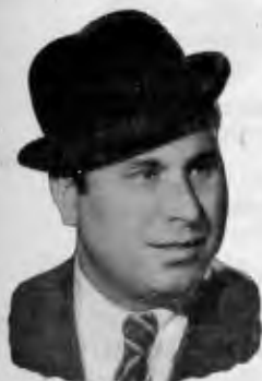
Niño de la Calzada