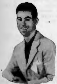
Niño de la Ribera