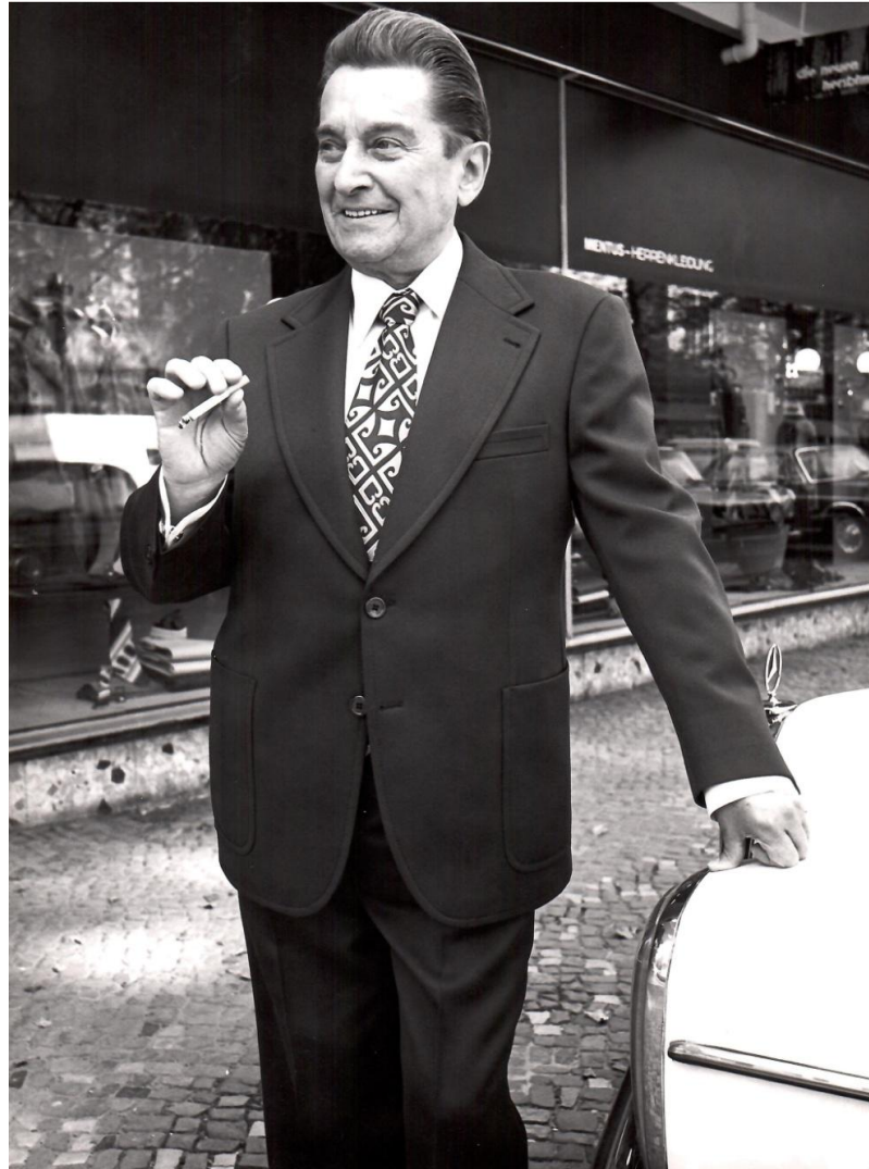
Mitte der 1970er Jahre in Düsseldorf