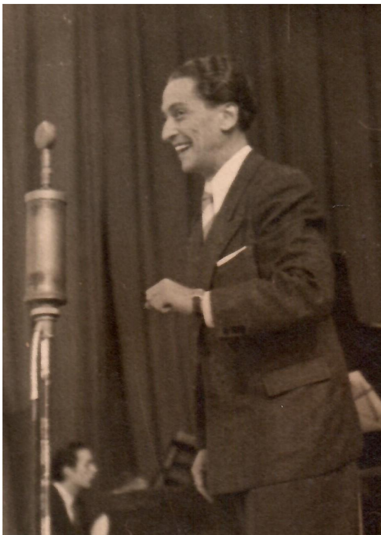
Auftritt vor Publikum, wahrscheinlich in der Ostzone, Ende der 1940er Jahre