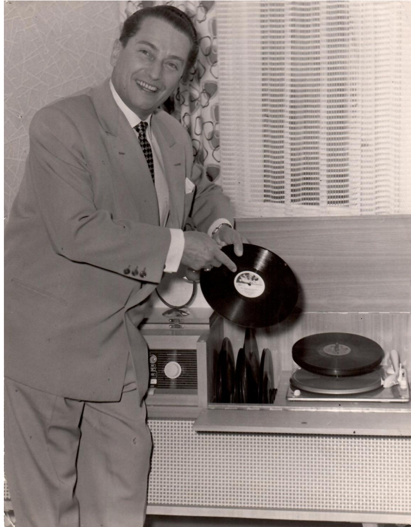
Zuhause in der Thorwaldsenstraße 5a, Berlin-Steglitz, zweite Hälfte der 1950er Jahre